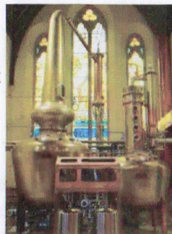
La distillerie Pearse and Lyons fabrique une centaine de bouteille par an.

Après une aération : une touche de cacao et de fruits secs viennent accompagner des notes de compote de pomme, de clou de girofle et de crème anglaise.